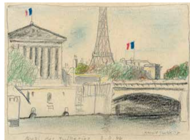
Kamil Lhoták: Paris 47 A unique album of fourteen drawings from the French metropolis

Paris played the role of Mekka for Lhoták's entire generation, and for him personally it also represented the cradle of many technical inventions that he admired since his youth and which often inhabited his works. The motifs of Paris have appeared in Lhoták's work since the late 1930s when he visited the city with his mother. On his second visit in September 1947, however, Lhoták's drawing skills and experience have already been fully developed into swift sovereignty, enhanced by a simple yet refined technique of colored pencils.