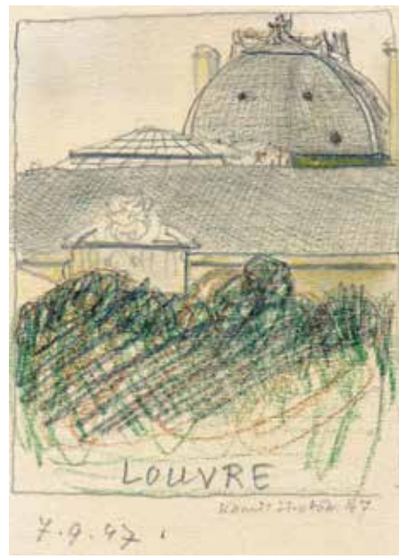
Kamil Lhoták: Paříž 47 Unikátní album čtrnácti kreseb z francouzské metropole

Paříž hrála pro celou Lhotákovu generaci roli Mekky, pro něj osobně navíc představující kolébku mnoha technických vynálezů, které od mládí obdivoval a jimiž často zaplňoval svá díla. Pařížské motivy se v Lhotákově díle objevují již od konce 30. let, kdy město navštívil s matkou. Při druhé návštěvě v září 1947 však byly Lhotákovy kresebné schopnosti i zkušenosti již plně rozvinuty do pohotové suverenity, umocněné prostou, ale přitom rafinovanou technikou barevných tužek.